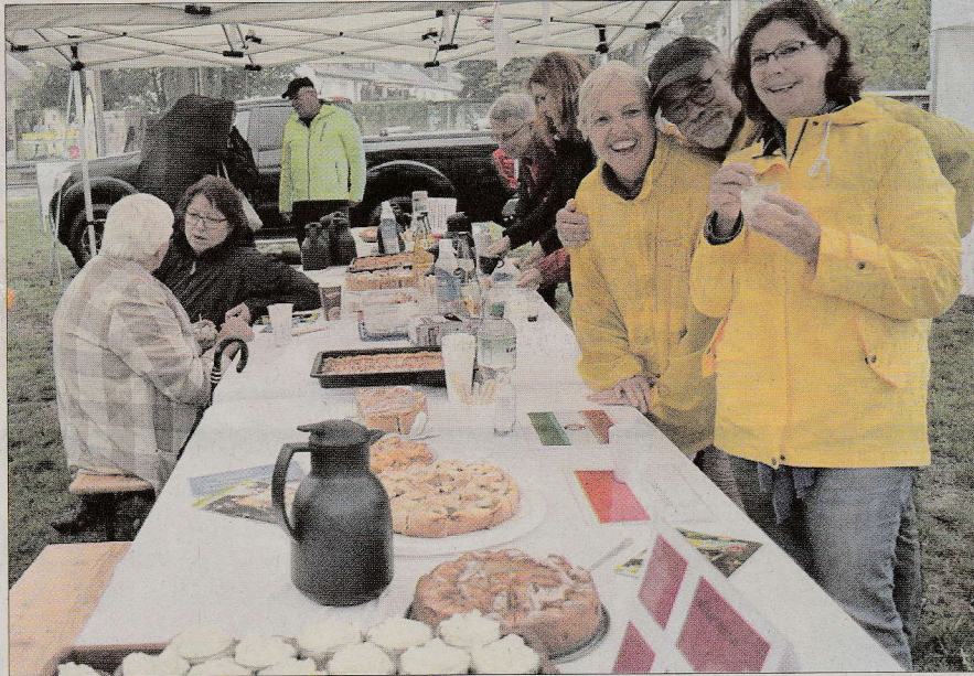
Test gelungen: Die Bürgervereinigung Holweide und der Runde Tisch Holweide testeten mit den Anwohnern die verschiedenen Apfelkuchen beim ersten internationalen Apfelkuchenfest.

Kölnische Rundschau Dienstag 2. Oktober 2018 (263.000 gem. mit Kölner Stadtanzeiger)