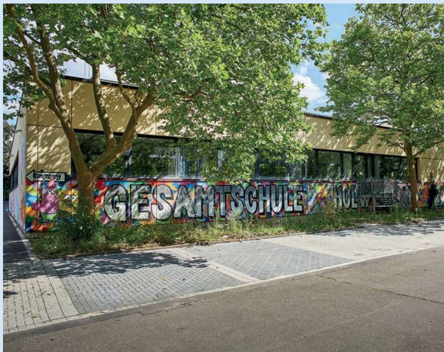
Vorbild für ganz Deutschland: Gesamtschule Holweide

Auch das Sport-, Kultur- und Freizeitangebot ist vielfältig und steht zum Teil auch Anwohner*innen zur Verfügung: mehrere Fußball-, Basketball und Beachvolleyballfelder, Klettermöglichkeiten inklusive Boulderblock, Streuobstwiese und Schülergarten; aber auch die Schulband, das Zirkusprojekt Zappelino, die Theatergruppe und der von Schülern organisierten Dritte-Welt-Laden sind über das Veedel hinaus bekannt. ■ ANJA ALBERT