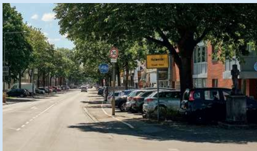
Holweides ungeliebtes Zentrum: Bergisch-Gladbacher Straße