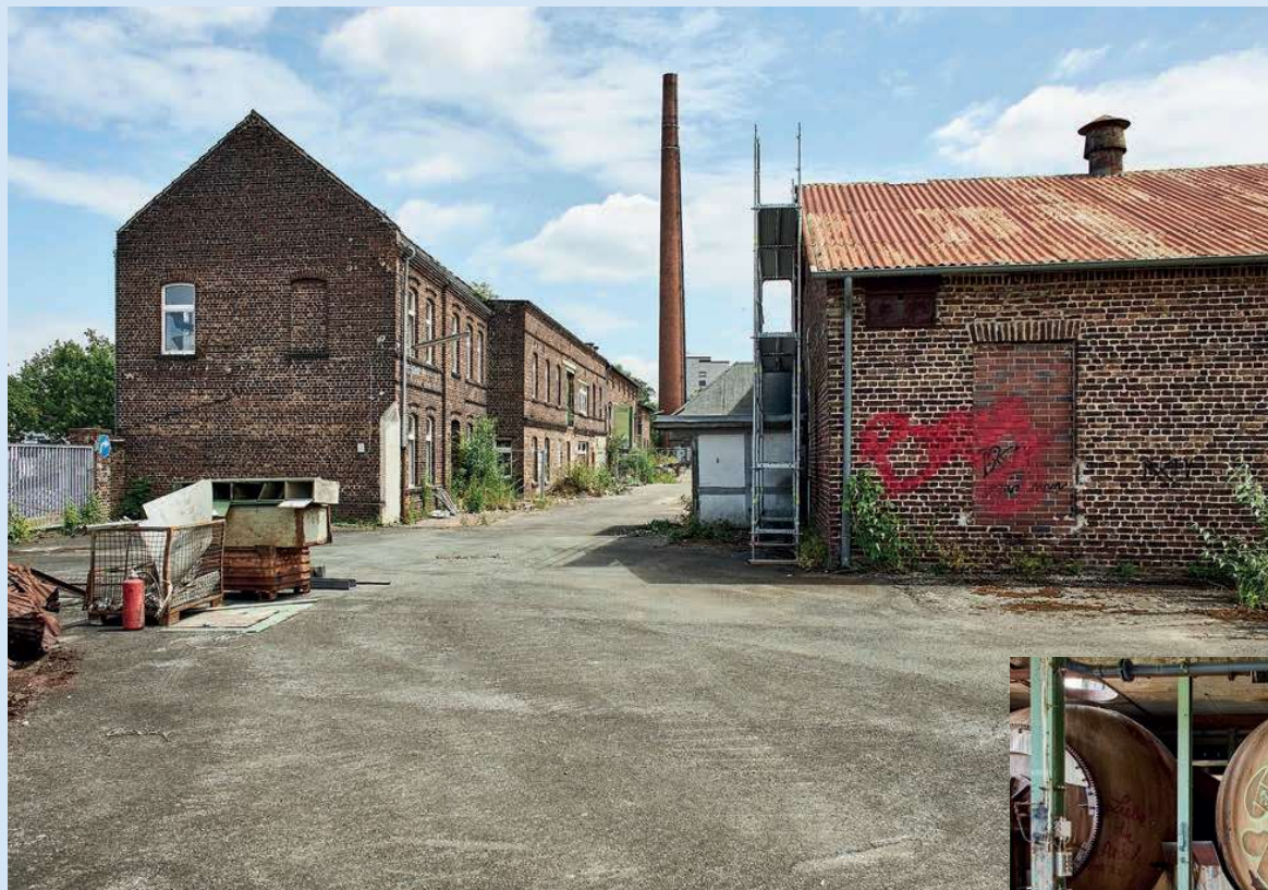
Industriegeschichte an der Strunde: Alte Baumwollbleicherei mit Kugelkocher (rechts)