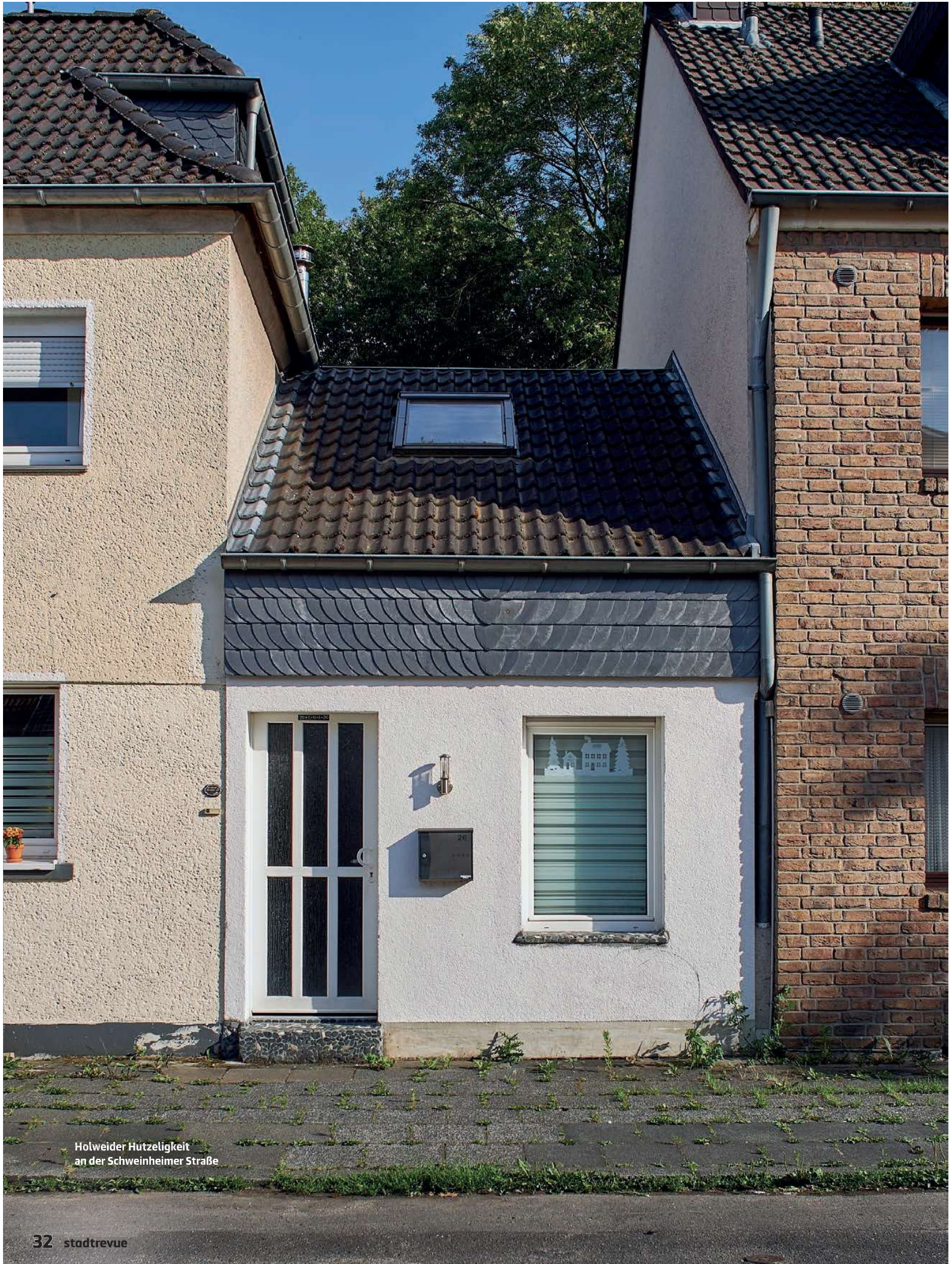
Holweider Hutzeligkeit an der Schweinheimer Straße