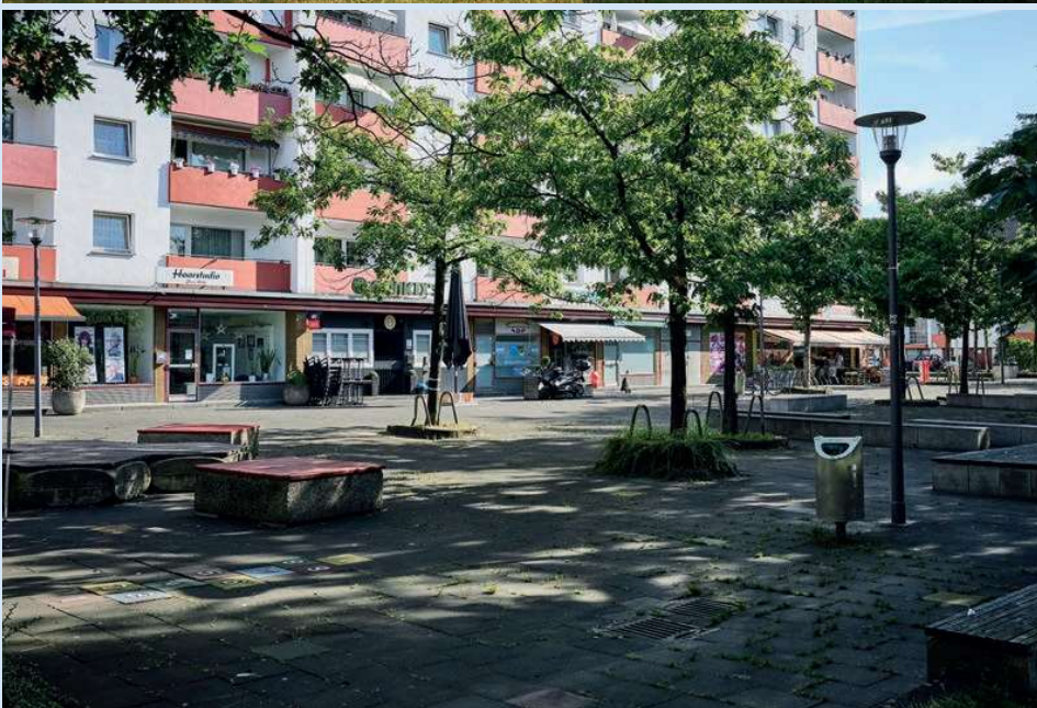
Inoffizielles Zentrum des Holweider Nordens: der »Rewe-Platz«. Oben: Siedlungsbau im Holweider Norden