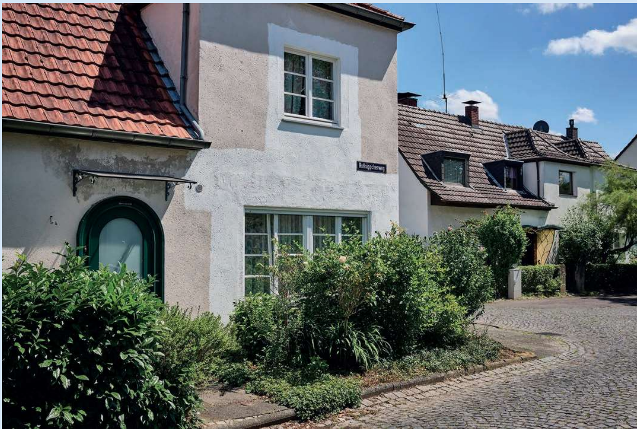
Städtische Prägung, dörfliches Ambiente: Haus in der Märchensiedlung