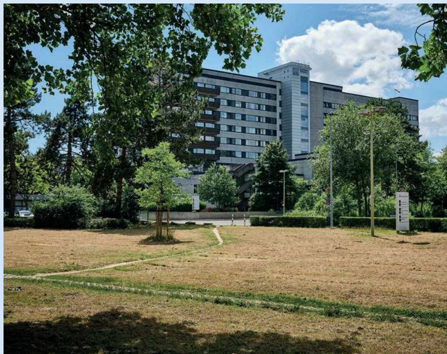
Zukunft ungewiss: Klinikum Holweide