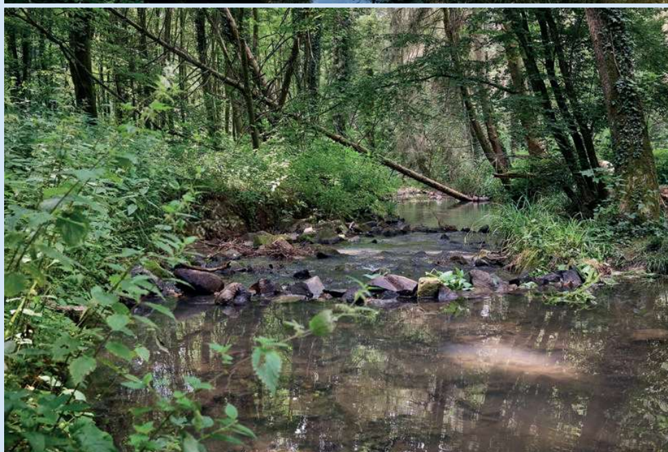
Die Strunde war ein wichtiger Bach für die Kölner Textilindustrie. Am Kreuzwasser (oben) ermöglicht ein Bauwerk, dass sich Strunde und Faulbach kreuzen können

Länge: ca. 12km Fahrrad: 1 Stunde zu Fuß: 3 Stunden