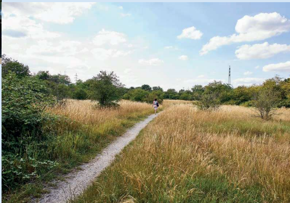
Ich war ein Bauschuttplatz: Holweider Brache

Radfahrende sollen zudem bald einen Schnellradweg von Deutz nach Bergisch-Gladbach bekommen. Über die genaue Route wird im Moment noch diskutiert, wann sie eröffnet wird, ist ebenso offen. ■ CHRISTIAN WERTHSCHULTE